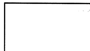
Polegar direito 2